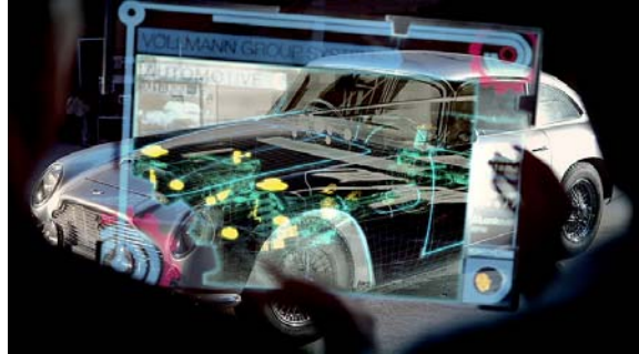
Filmausschnitt "Erfolg durch Wandel"

Weitere Informationen unter http://www.tmf.de