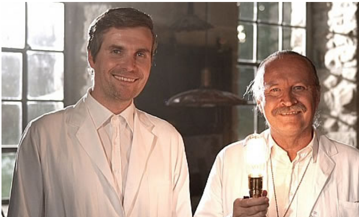
Filmausschnitt "Erfolg durch Wandel"